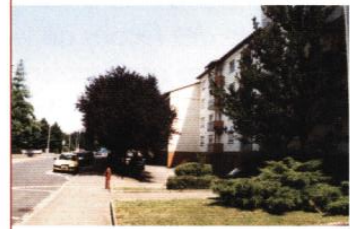
◀ Rue des Champs Verts

Ce secteur, constitué d'immeubles d'habitation, s'est organisé le long de l'avenue des Champs Verts et marque la limite provisoire de l'urbanisation de la ville. Le développement futur de la Décapole, sur sa limite Est, pourrait permettre de remédier à des arrières difficiles, en repensant notamment la gestion du stationnement et l'aménagement des espaces extérieurs.