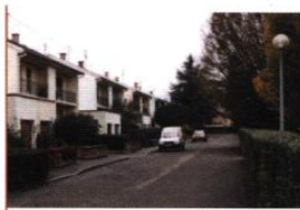
▲ Square Saint-Charles

La rue des Bruyères et le square Saint-Charles résultent de la réalisation de petites opérations d'habitat groupé. Ces dernières se réduisent à une ligne bâtie, fabriquant un front continu sur rue. Leur contiguïté avec des équipements de quar-