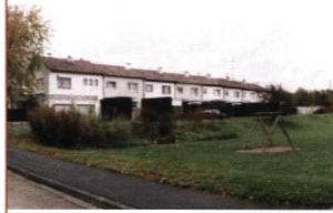
◀ Rue des Bruyères