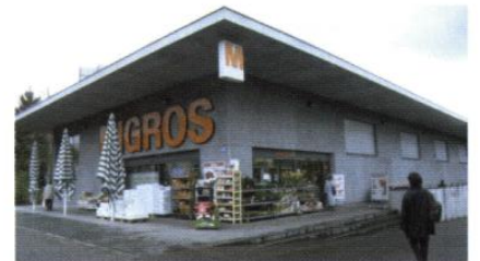
▲ Un large débord de toiture protège l'entrée du magasin et souligne l'enseigne.