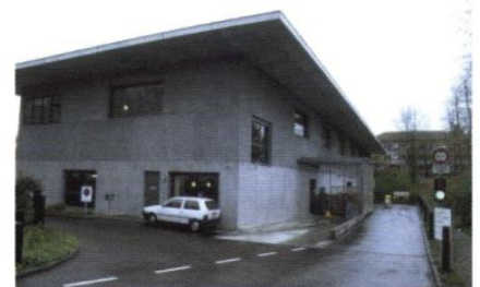
▲ La cour de service et les aires de déchargement sont intégrées à l'architecture du bâtiment