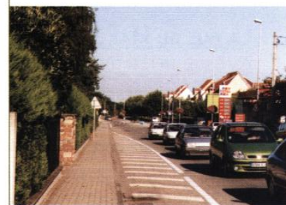
▲ La rue du Maréchal Juin

La voiture est dominante, les traitements des espaces renforcent sa présence: route surdimensionnée accentuant l'effet de coupure, traversée piétonne souterraine ou en surface problématique, cheminements peu agréables, impact visuel fort des parkings.