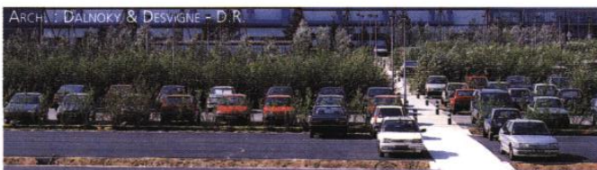
▲ Des végétaux fragmentent l'aire de stationnement en compartiments, améliorant ainsi son insertion paysagère. Un cheminement, séparé du parcours voiture, conduit en toute sécurité le visiteur vers l'entrée du bâtiment.