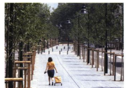
▲ Une allée piétonne généreuse dédouble l'artère et met en scène les déplacements inter-quartiers.

L'organisation de l'avenue clarifie la place de chaque fonction : promenade piétonne, case de stationnement, voie de circulation. Des mâts d'éclairage spécifiques et des plantations affirment l'image de l'avenue