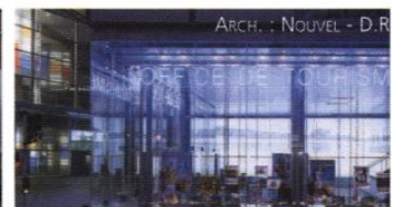
▲ L'image nocturne du secteur commercial a été intégrée à la conception des bâtiments.