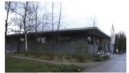
▲ Le supermarché s'est implanté en maintenant sur l'un de ses côtés un écran de nature.