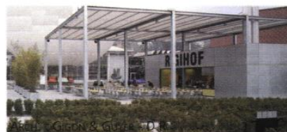
▲ Un portique "auvent" prolonge la cafétéria et affirme le rôle du petit équipement dans l'espace public.