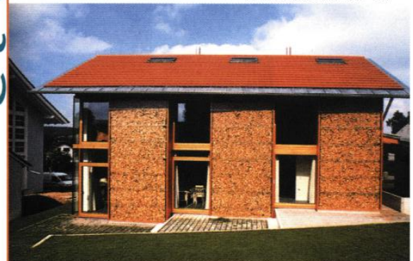
ARCH : GASSNER & ZARCKY - DR

▲ Cette maison de 141 m 2 sur 6,34 ares tire parti de la faible pente et de l'orientation d'un terrain banal en lotissement