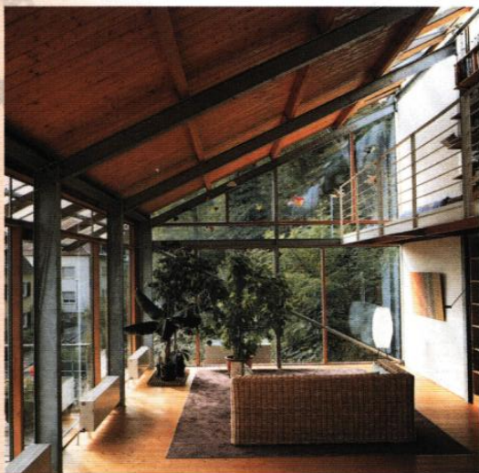
ARCH : OTT - DR