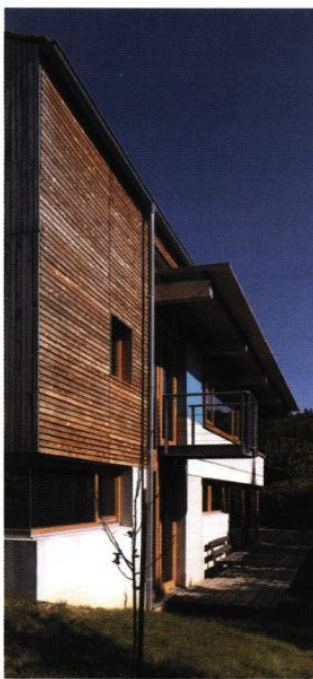
ARCH : ERHLER - DR

Bois sur socle massif, cette maison de 108 m 2 sur 5,26 ares s'inspire de la tradition locale tout en exploitant la vue et l'ombre des arbres du terrain