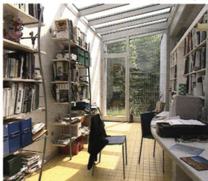
▼ Une pièce en plus

Un bon projet prend corps progressivement à partir d'une idée directrice (le parti architectural) : quels sont les éléments majeurs du site et du programme, quelles relations instaurer entre eux, quels arbitrages rendre entre des exigences qui peuvent être contradictoires ? Exprimer ce parti architectural est le rôle de l'esquisse. Vous pouvez missionner le concepteur sur l'esquisse (compter environ 6 pour mille des travaux HT) avant de vous engager plus durablement avec lui..