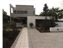
▼ Cour d'entrée